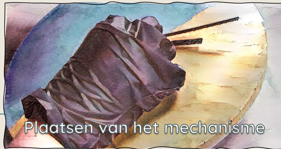
Plaatsen van het mechanisme