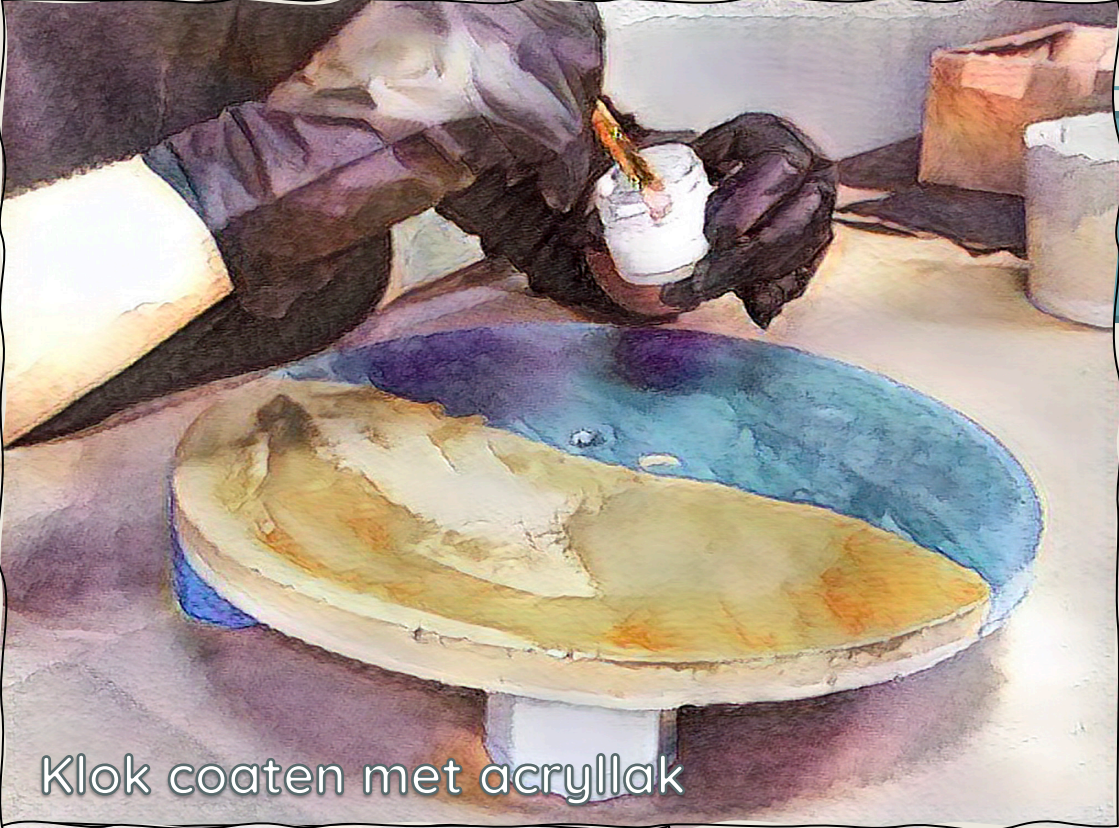
Klok coaten met acryllak